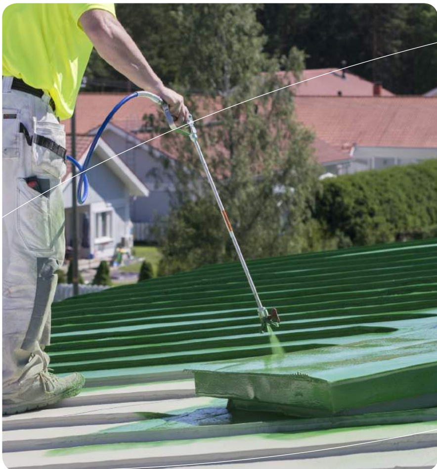
Polyureapinnoitteen päälle voidaan ruiskuttaa UV-säteilyssä värinsä pitävä 2-komponentti Topcoat, jota on saatavilla lähes kaikissa RAL-värikartan sävyissä